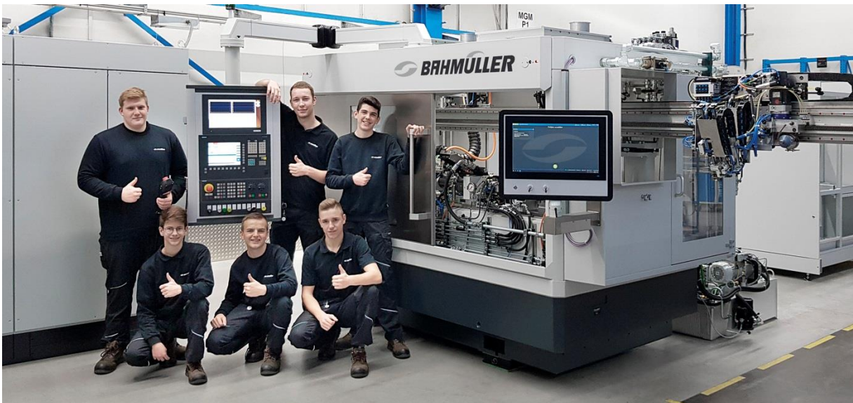
Teil der Ausbildungsabteilung